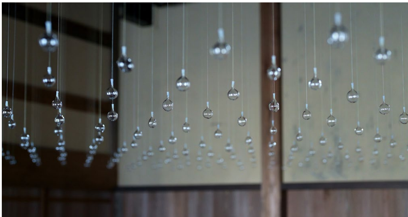
Runa Kosogawa: „Weaving Life—Hokuriku 2022“, 2022, borosilicate glass, silicon, silk thread dyed with Hokuriku plants